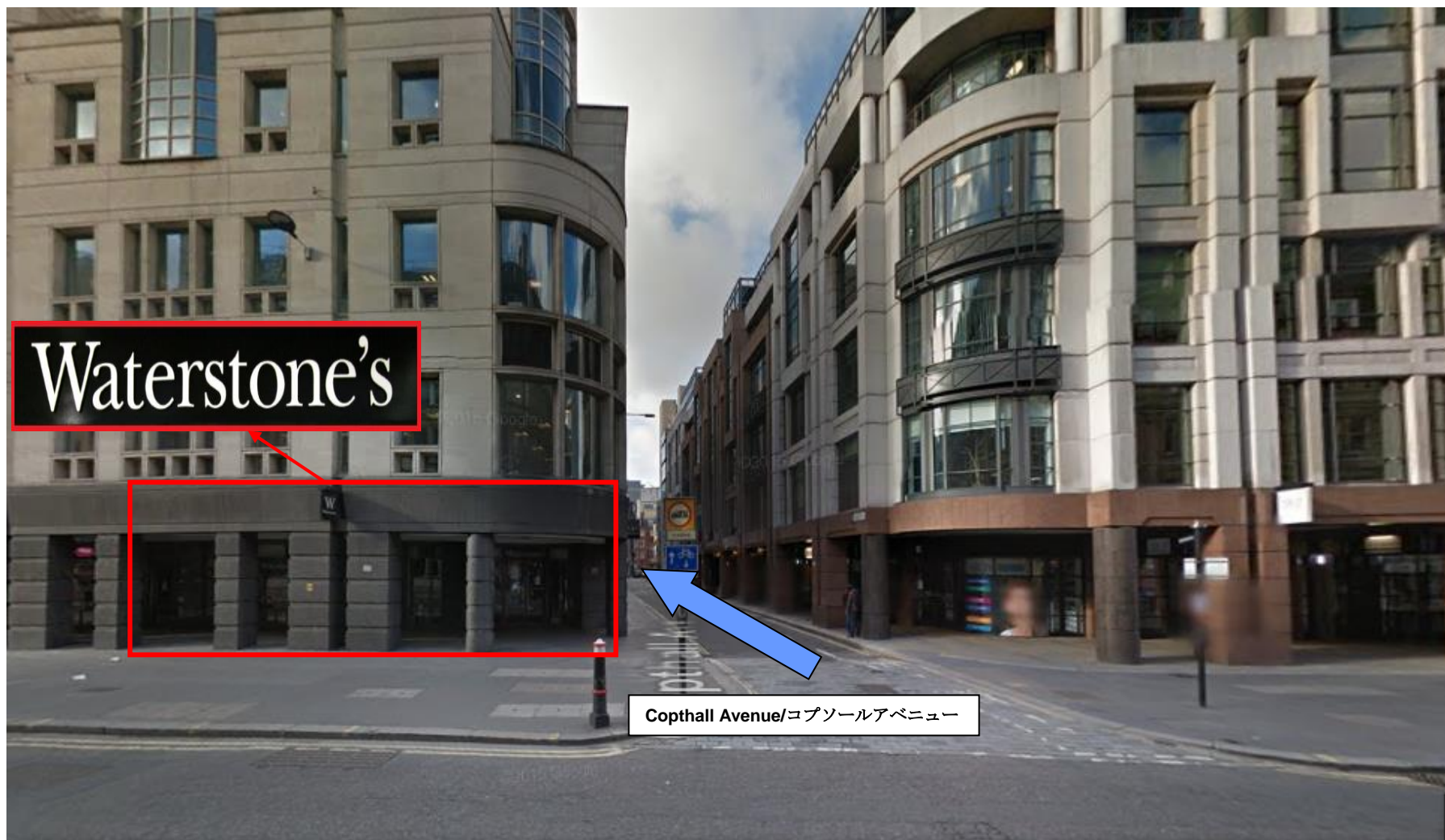
「Cophall Avenue/コプソールアベニュー」を進む。