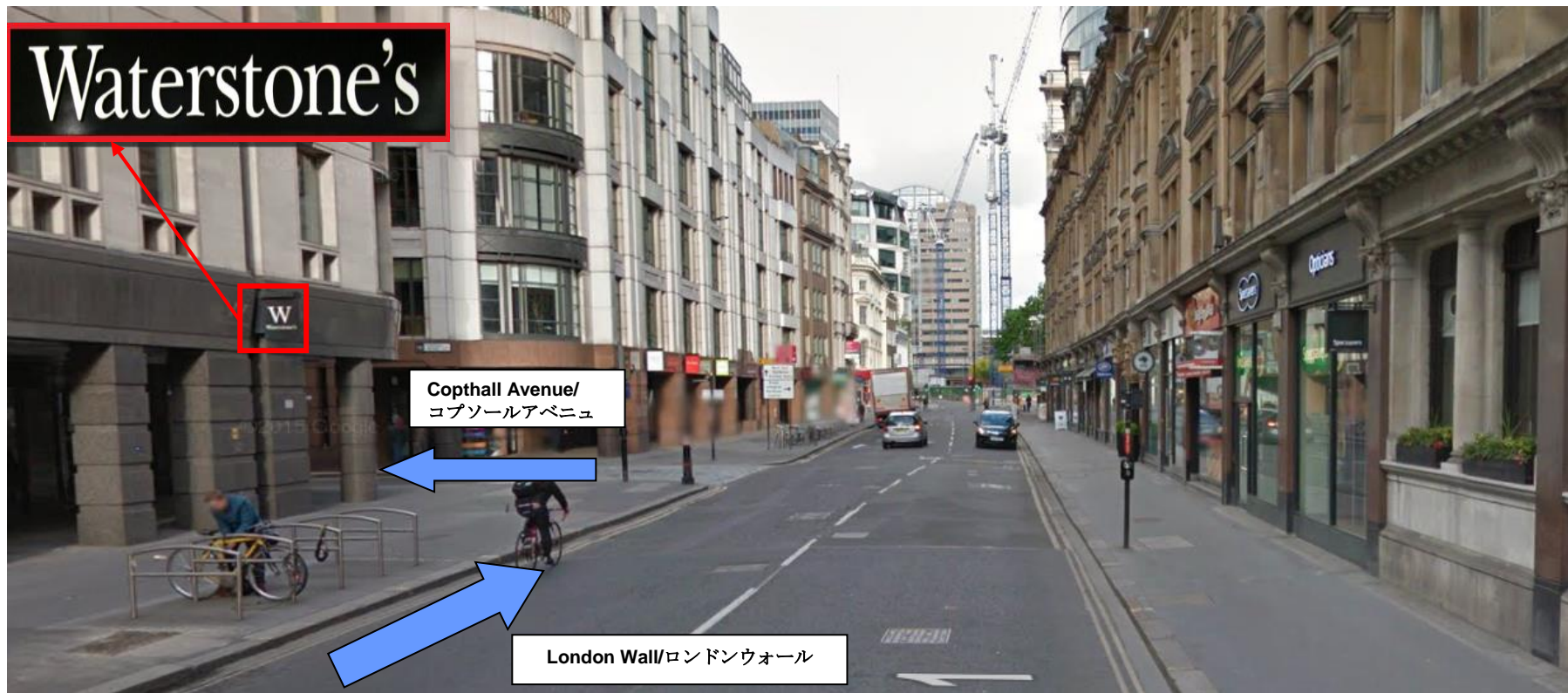
「London Wall/ロンドンウォール」を進むと左手に本屋の「Waterstones/ウォーターストーンズ」が見えてくる。 「Waterstones/ウォーターストーンズ」を過ぎたすぐの道「Copthall Avenue/コプソールアベニュー」を左折する。